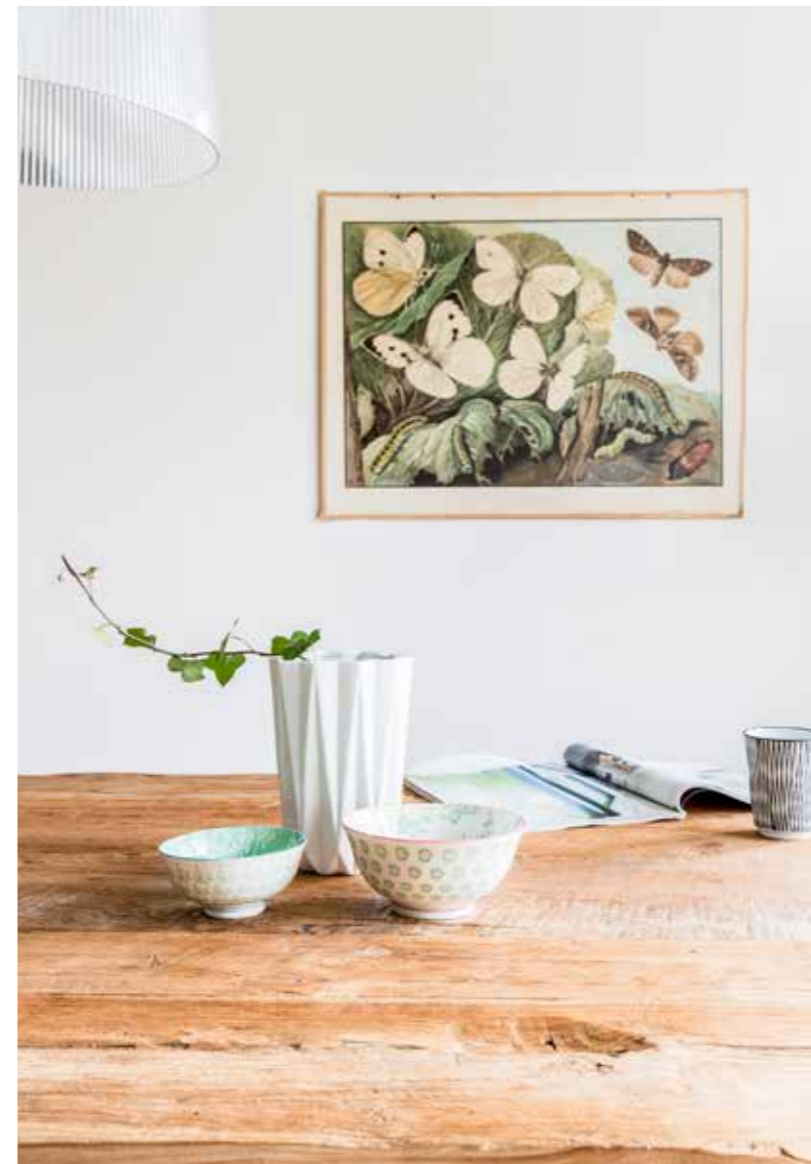
Linde verkoopt veel oude schoolplaten en landkaarten in haar winkel. De vaas is van Bloomingville, servies via Kitchen Trend Products.

< Het uiltje komt uit Lindes winkel. De hanger in de vorm van een hart kreeg ze van haar moeder.