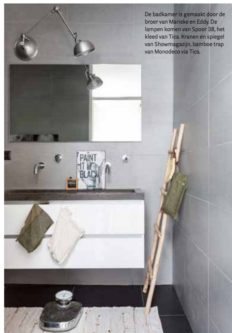
De badkamer is gemaakt door de broer van Marieke en Eddy. De lampen komen van Spoor 38, het kleed van Tica. Kranen en spiegel van Showmagazijn, bamboe trap van Monodeco via Tica.

STYLING SABINE BURKUNK | TEKST FLOOR ROELVINK