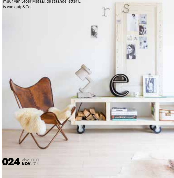
Op de kast staat een Trash Me-lamp van &Tradition. De vlinderstoel is een replica en kocht Marieke bij lil.nl. De letter vond Marieke bij quip&Co, een van haar favoriete winkels. De oude paneel deur is van Jan van IJken. De kast van hout heeft Marieke op maat laten maken. Hij stond eerst rechtop in de keuken, later heeft Marieke er wieltjes onder gezet en kreeg de kast een tweede leven in de woonkamer. Het witte vachtje is van groothandel Tica, de letters aan de muur van Stoer Metaal, de staande letter E is van quip&Co.